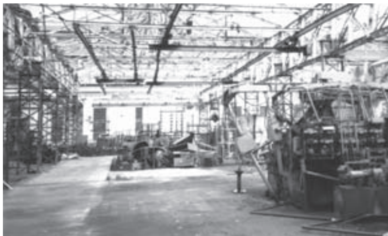
Фабрика „Засџава“ у Крагујевцу. При обиласку директор је дуго и ојорчено осуђивао НАТО.

У Крагујевац сам стигао у суботу, крајем априла 2002. године. Срећом, започео сам разговор са једним сељаком док се аутобус полако приближавао граду, јер ми је управо он помогао да дођем до једног од директора фабрике Засџава који ме је повео у обилазак погона који су опет радили али са минималном производњом. Директоров енглески је био лош, али на основу говора тела и тона ипак сам га добро разумео. Била је то сложена и бесна осуда политике НАТО-а. И био је сасвим у праву. Стидео сам се што сам из једне од земаља чланица ове алијансе.