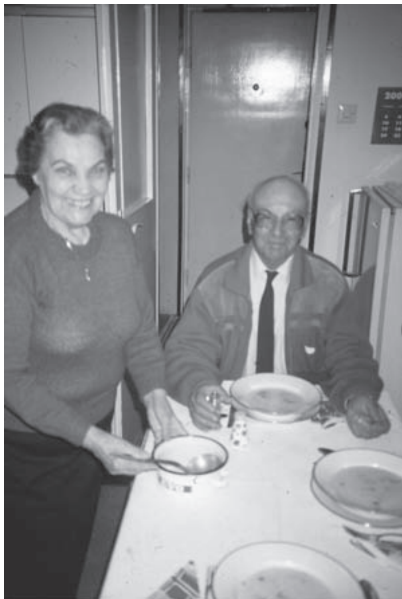
Агела и Сџејан Писџиџајџ били су јосџољубиви домаџини.